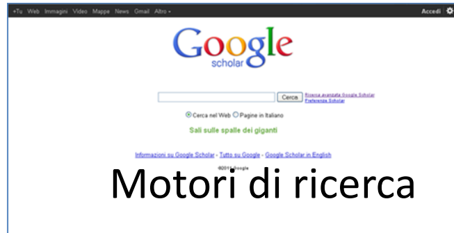
Motori di ricerca