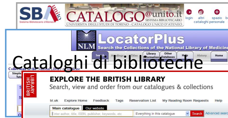
Cataloghi di biblioteche